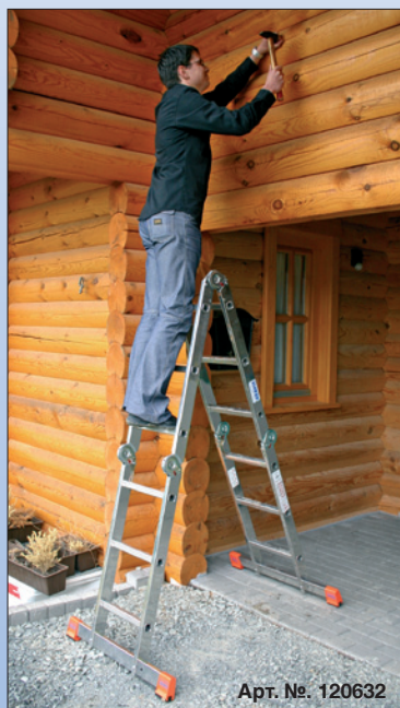
Арт. №. 120632