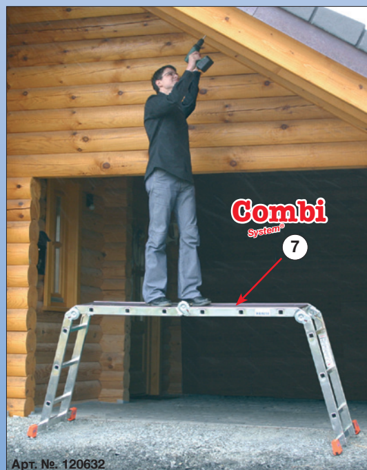
Арт. №. 120632