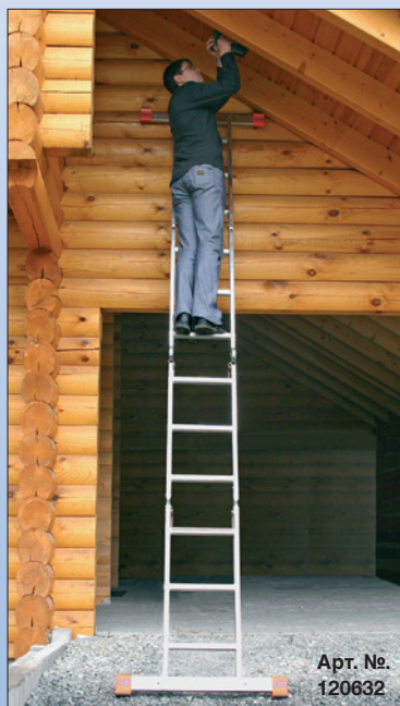
Арт. №. 120632