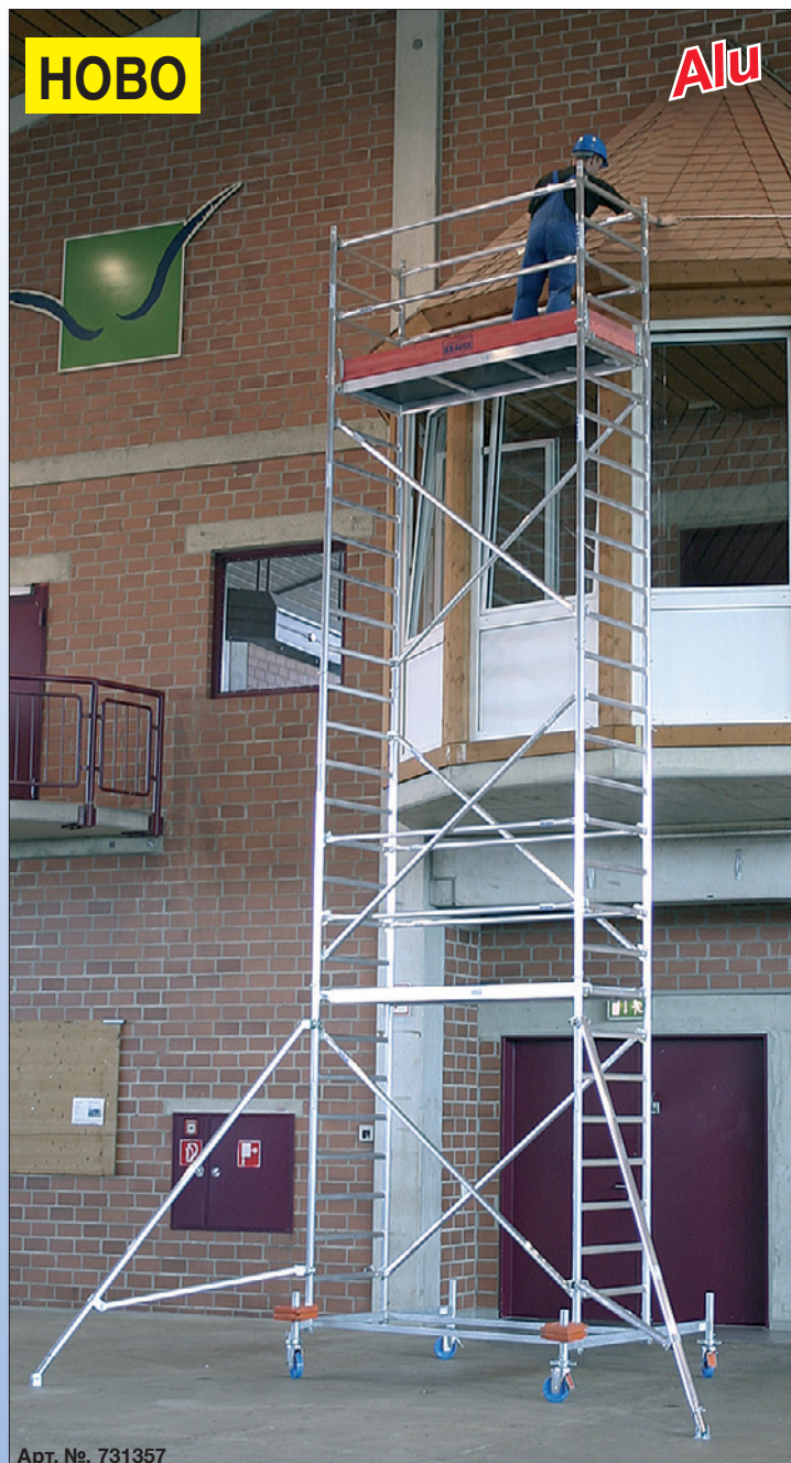
Арт. №. 731357

Частите от системата ще намерите след страница 84.