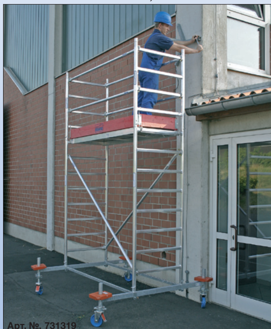
Арт. №. 731319